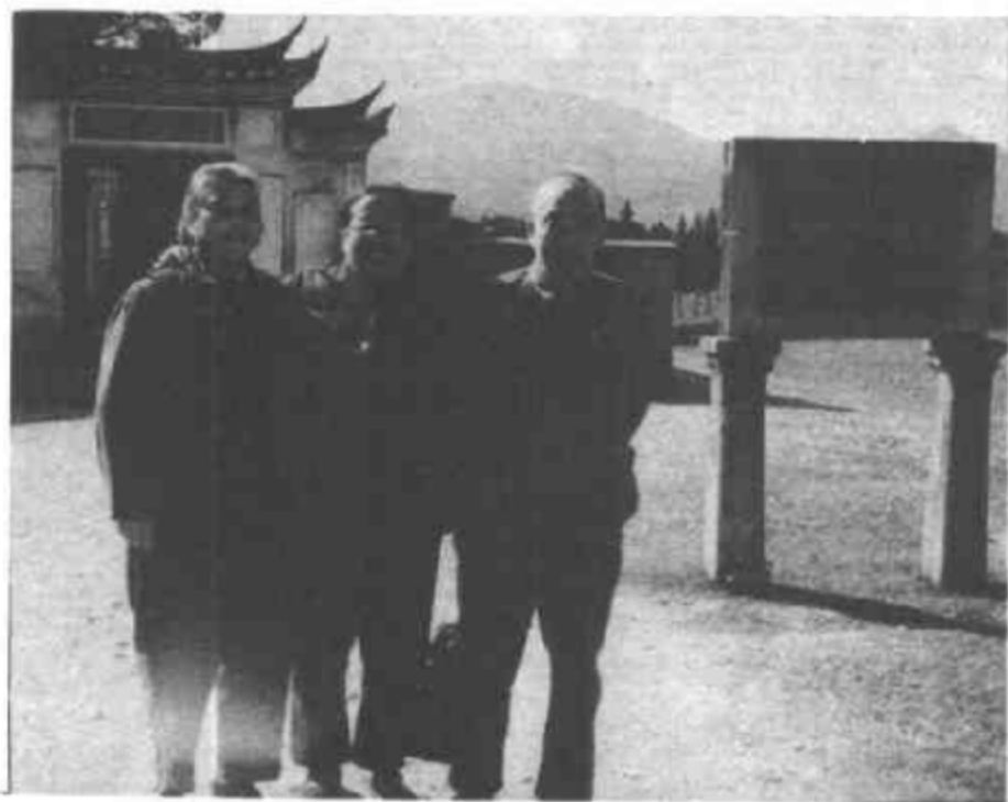
1978年10月，僑夫人王希宁，与政协副主席康克清（左）参观古田会议旧址合影。