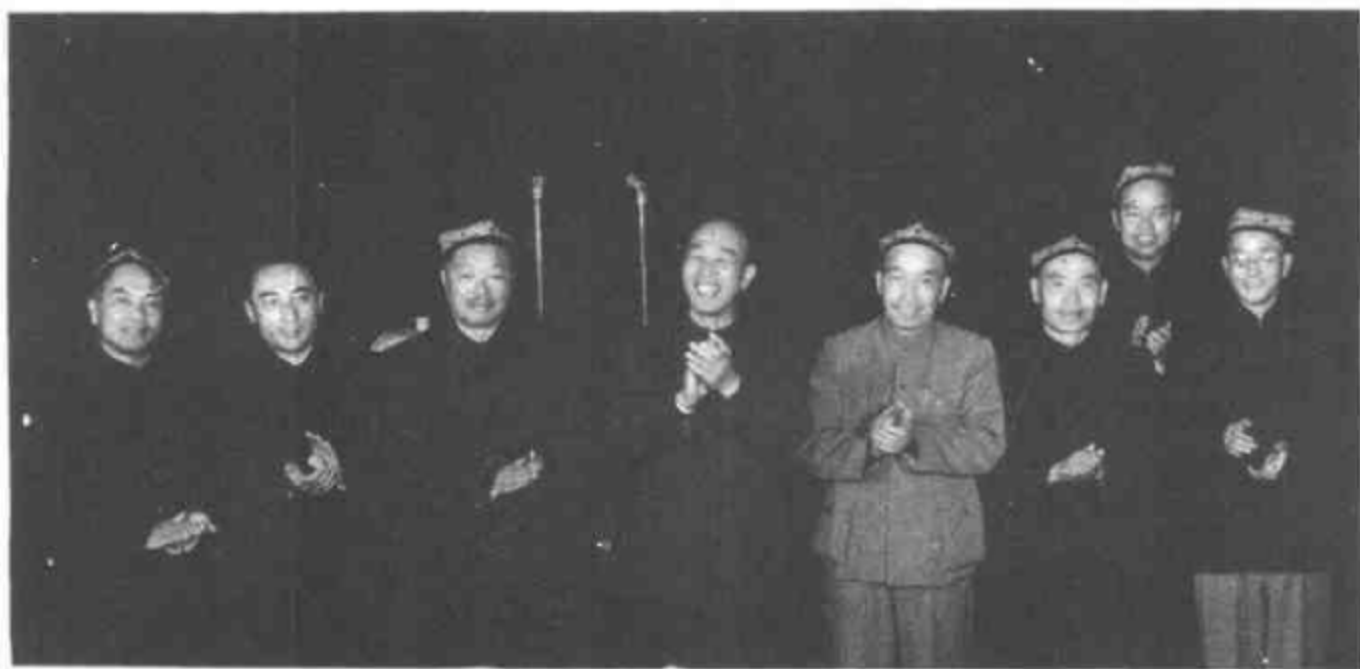
1965年10月，在庆祝新疆维吾尔自治区成立10周年的宴会上。左起：陈漫远、赛福鼎、贺龙、王恩茂、高克林、刘春、沙里斯、陈克寒。