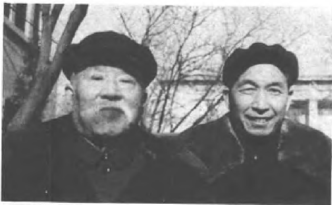
与谢觉哉同志合影。