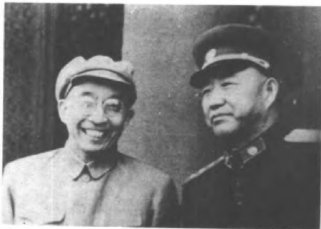
1958年10月，高克林与董其武上将在天安门城楼上合影。