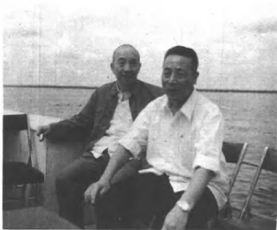
1980年7月，高克林和已故全国著名劳动模范张秉贵(右)在黑龙江省视察工作时合影。